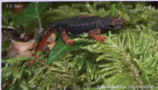
Salamandrina dagli occhiali

Nell’ambito del progetto sono state inoltre approfondite le conoscenze su vari gruppi di invertebrati e, per i mammiferi, sulla distribuzione del Lupo e della Lontra nel territorio.